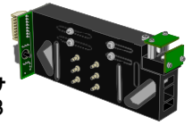
定置用センサ (例) IFM-23